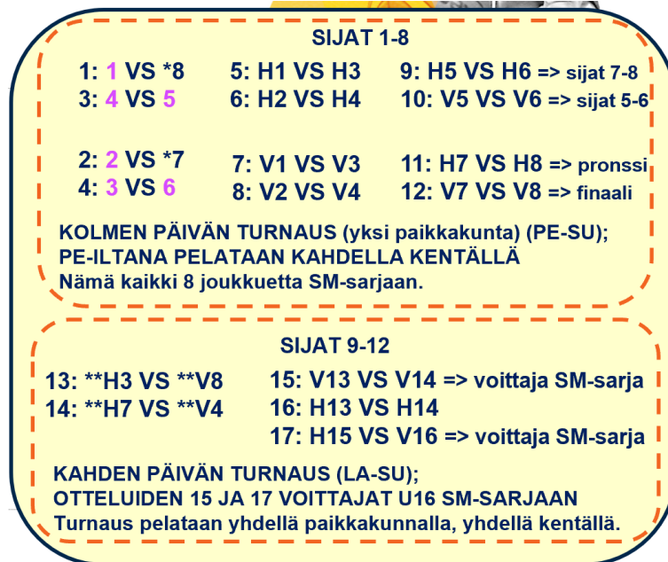
Kuva 2: SM-lopputurnaus II otteluparit

Kaavion alemmassa osassa neljä joukkuetta pelaa cup-muotoisesti kahdesta SM-sarjapaikasta seuraavalle pelikaudelle 16-vuotiaiden SM-sarjaan.