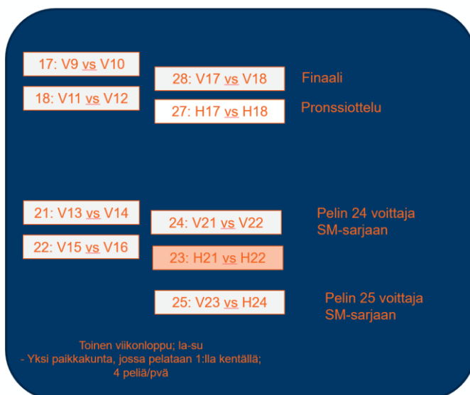
Kuva 2: SM-lopputurnaus II otteluparit

Kaavion alemmassa osassa neljä joukkuetta pelaavat cup-muotoisesti kahdesta SM-sarjapaikasta seuraavan pelikauden 2020-21 16-vuotiaiden SM-sarjaan.