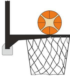
Kuvio 3 Pallo on kosketuksessa renkaaseen.

31-18 Toteamus. Kyseessä on korin häirintä pelitilanneheitossa, jos hyökkääjä tai puolustaja koskettaa koria (korirengasta tai korisukkaa) tai korilevyä silloin, kun pallo on kosketuksessa renkaaseen, ja sillä on edelleen mahdollisuus mennä koriin.