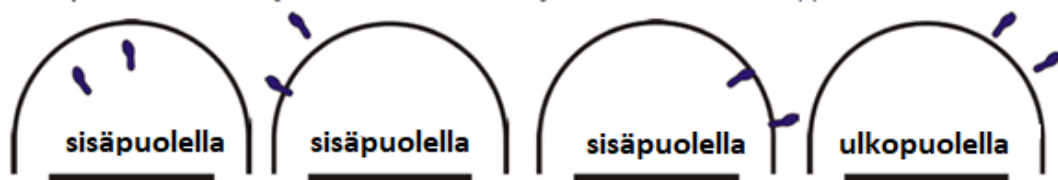
Kuvio 5 Pelaajan asema törmäyskaarialueen ulko-/sisäpuolella

33-4 Esimerkki: A1 yrittää hyppyheittoa, joka alkaa törmäyskaarialueen ulkopuolelta. Sen jälkeen hän törmäsi B1:een, joka on kosketuksessa törmäyskaarialueeseen.