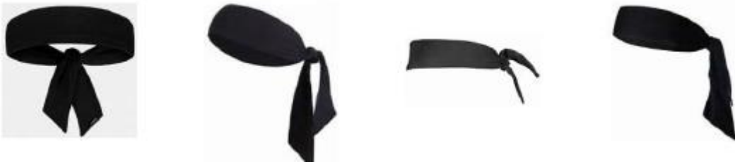
Kuvio 1 Esimerkkejä huivimaisista otsanauhoista

4-4 Toteamus. Huivimaista otsanauhaa ei saa käyttää.