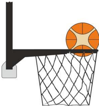
Kuvio 4 Pallo on korin sisässä

31-23 Toteamus. Jos puolustava pelaaja koskettaa palloa, joka on korin sisässä, kyseessä on korinhäirintärikkomus.