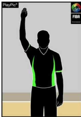
Kuva 1: avoin kämmen ylhäällä pysäytä kello

Esimerkki 1: Jos erotuomari viheltää askeleet, hän nostaa käden suorana ylös ajan pysäyttämisen merkiksi (kuva 1) sekä näyttää käsimerkeillä askelrikkeen merkkiä. Heti kun erotuomari on suorittanut askelrikkeen näytön, voi ajanottaja painaa summeria.