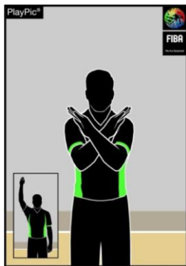
Kuva 3: vaihto

Huom! Kun ajanottaja painaa summeria, on hänen näytettävä erotuomarille miksi hän painoi summeria. Jos summeria painettiin vaihdon merkiksi, tulee ajanottajan näyttää vaihdon merkkiä (kuva 3) erotuomarille. Jos summeria painettiin aikalisän merkiksi, tulee ajanottajan näyttää aikalisämerkkiä (kuva 4).