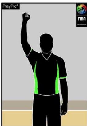
Kuva 2: Nyrkki ylhäällä pelikello seis virheestä

Esimerkki 2: Jos erotuomari on viheltänyt virheen, nostaa hän käden nyrkissä ylös merkiksi ajan pysäyttämisestä (kuva 2). Tämän jälkeen erotuomari etsii katsekontaktin pöytäkirjanpitäjään, näyttää hänelle virheen tekijän numeron, virheen syyn sekä miten peli jatkuu. Heti kun erotuomari on näyttänyt, miten peliä jatketaan, voi ajanottaja painaa summeria.